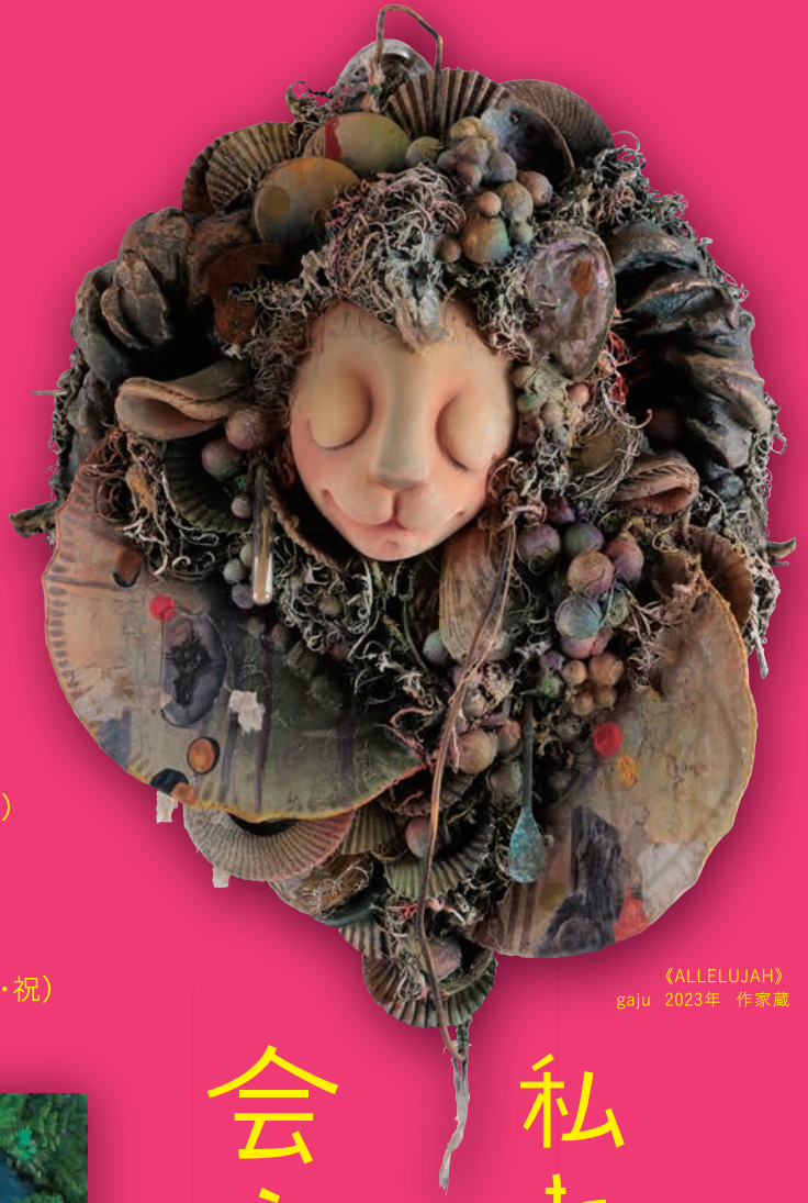
《ALLELUJAH》 gaju 2023年 作家蔵