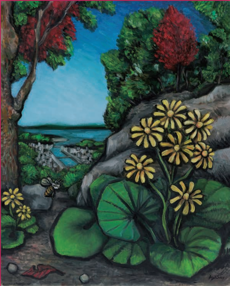
《石路の花 津奈木II》 青柳綾 2024年 作家蔵