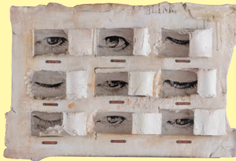
《瞬きの証》gaju 2016年 作家蔵