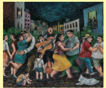
《みんなの音楽》青柳綾 2023年 作家蔵