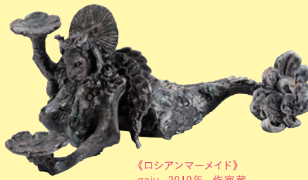
《ロシアンマーメイド》 gaju 2019年 作家蔵