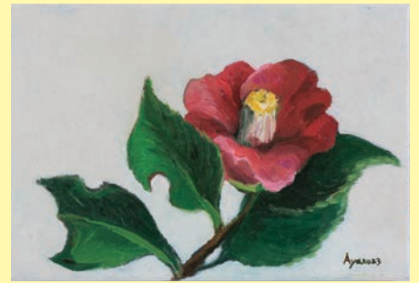
《虫食い椿》青柳綾 2023年 作家蔵