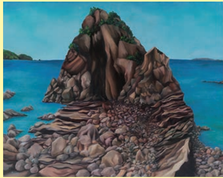
《鬼海ヶ裏》青柳綾 2020年 作家蔵