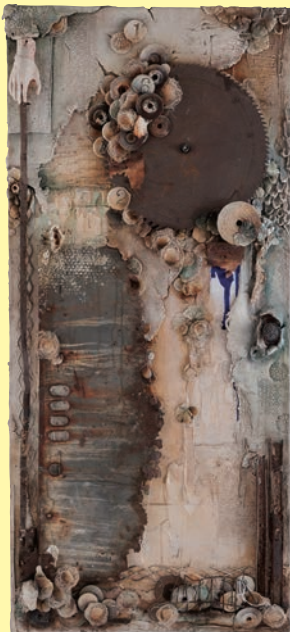
《通過点の扉》gaju 2011年 作家蔵