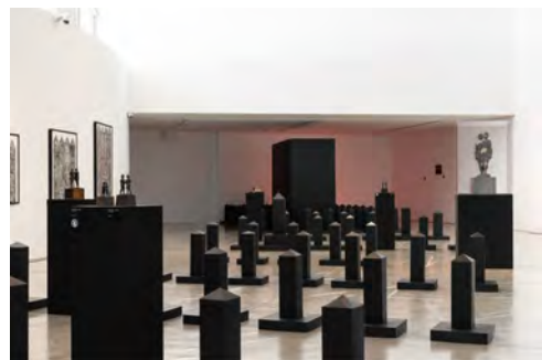
国際芸術センター青森での個展風景 2021年撮影

1985年、宮城県生。多摩美術大学美術学部彫刻学科卒業後、 東京芸術大学大学院美術研究科先端芸術表現専攻修了後、 筑波大学大学院人間総合科学研究科にて芸術学博士号を取得。 歴史を掘り起こし、社会現象に照らして、いま注目すべき問題を 作品や評論を通じて世に提起している。 多摩美術大学などで非常勤講師を務める。東京都在住。 評論家としても活動し、『芸術新潮』『東京新聞』に美術評を連載。 主な個展に「近代を彫刻／超克する―雪国青森編」(国際芸術センター 青森[ACAC]、2020-2021年)、主な単著に「近代を彫刻／超克する」 (講談社、2021年)。