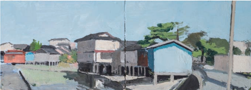
《鏡川の風景》2016 作家蔵