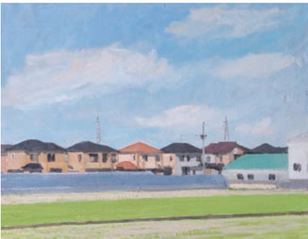
《ピニールハウスの見える住宅地》2016 作家蔵