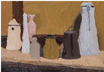
《水差し等のある静物》2016 作家蔵