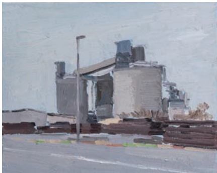
《セメントサイロ》2015 作家蔵