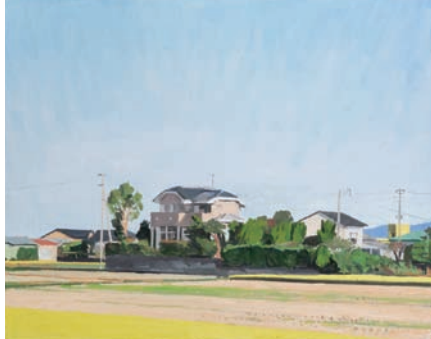
《朝日のある家》2015 作家蔵