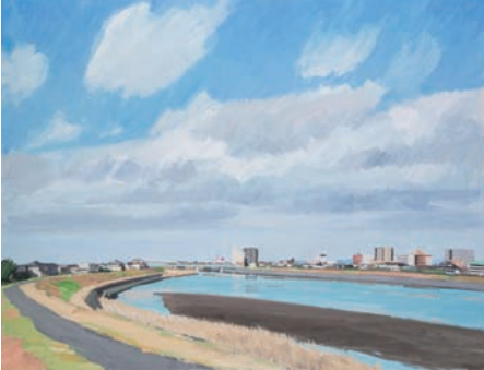
《前川の風景》2016 作家蔵