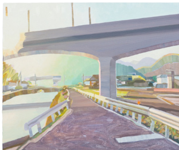
《朝をくぐる》2016 作家蔵