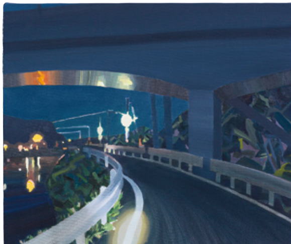
《夜明けをくぐる》2016 作家蔵