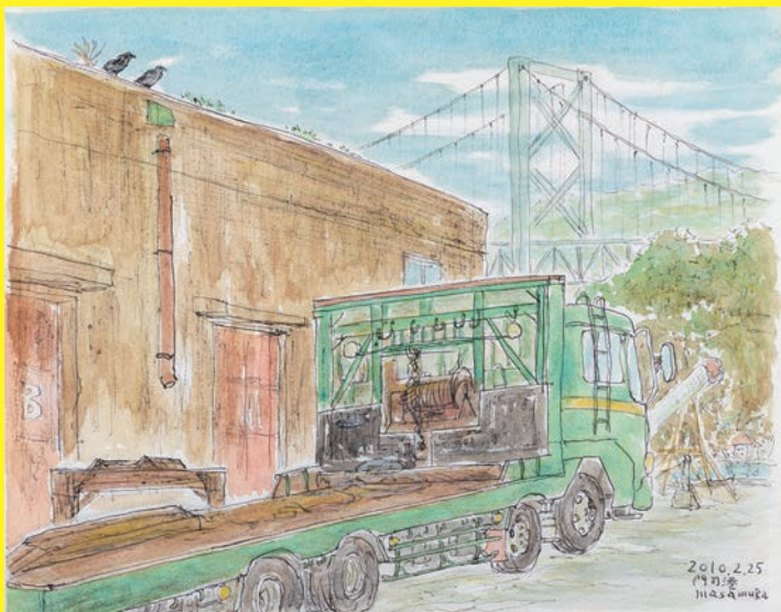
《門司港、いつものトラック》2010年 水彩 31.8×40.9cm 作家蔵

日時:4月25日(土) 14:00~15:00 話し手:正村タカシ 会場:1階展示室 定員:40名(申込不要・当日先着順) 参加費:観覧料のみ