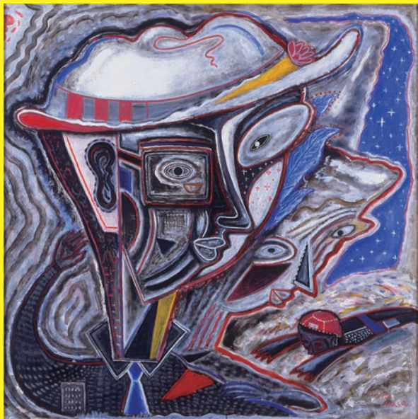
《浜辺にて》1992年 油彩 162.0×162.0cm 作家蔵