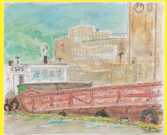
《門司港、いつもの岸壁》2010年 水彩 38.0×45.5cm 作家蔵