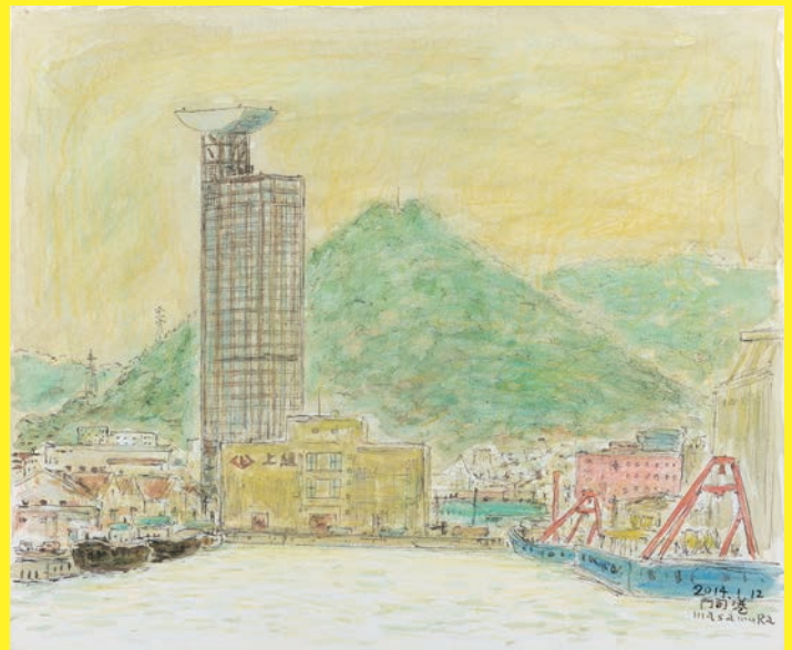
《門司港風景、ノーフォーク広場から》2014年 水彩 38.0×45.5cm 作家蔵