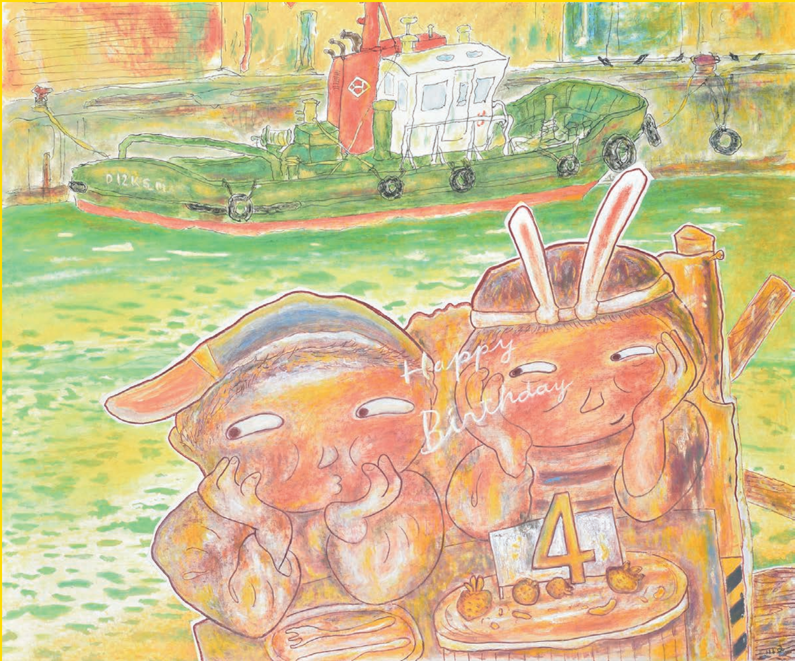
《門司港、風景、Happy Birthday》2019年 油彩 162.0×194.0cm 作家蔵