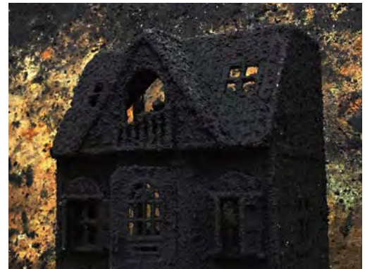
《A Doll's House -人形の家》部分・制作途中