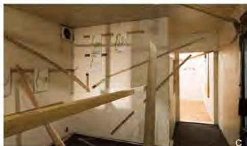
a) 2017 「川の交わり / 小さい時の井戸の感覚」 福岡アジア美術館・企画ギャラリーC b) 2018 「混雑のさかめ、塊のへんじ オブ・tic go.」九州芸文館 c) 2018 「古墳のまわりを走る」IAFshop*

※すべて参考作品