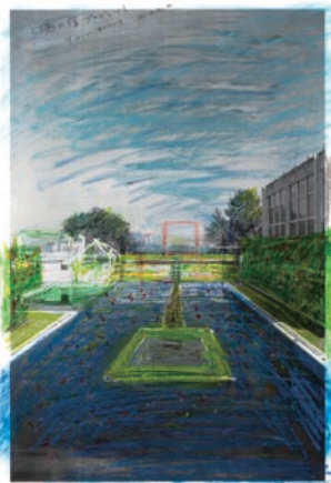
《入魂の宿》のドローイング 2020年

本展にて展示を予定していた新作《入魂の宿》は諸般の事情により公開を延期することとなりました。2021年度中の公開を目指していますので、詳細が決まりましたらホームページ等でお知らせします。