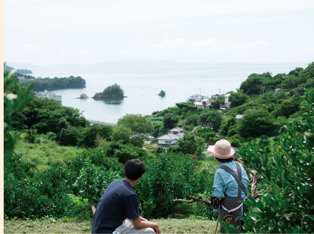
みかん山から不知火海を望む。左から裸島、弁天島、黒島。